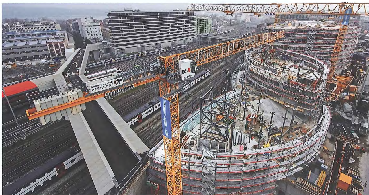
Le pétale 4 de la Maison de la paix (premier plan), relié à la Maison des étudiants Edgar et Danièle de Picciotto (arrière-plan) par la passerelle piétonne Sécheron-Nations. Janvier 2012.

Les principaux éléments du Campus de la paix s'inscrivent aujourd'hui dans l'espace et modifient en profondeur la physionomie du quartier situé entre Sécheron et la place des Nations.