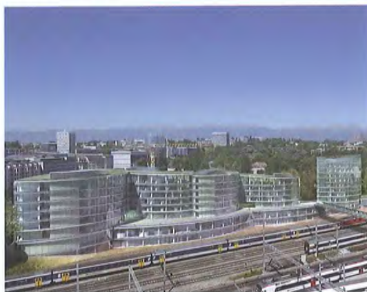
Vue générale du bâtiment. Image Eric OTT, IPAS Architectes SA.