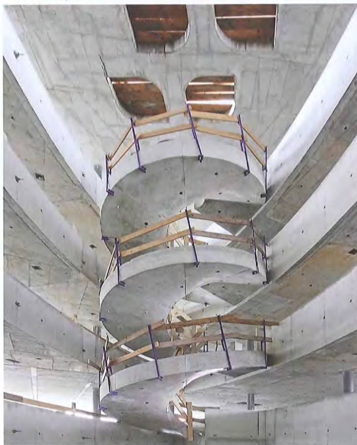
Escalier hélicoïdal dans le pétale 1. Janvier 2012.