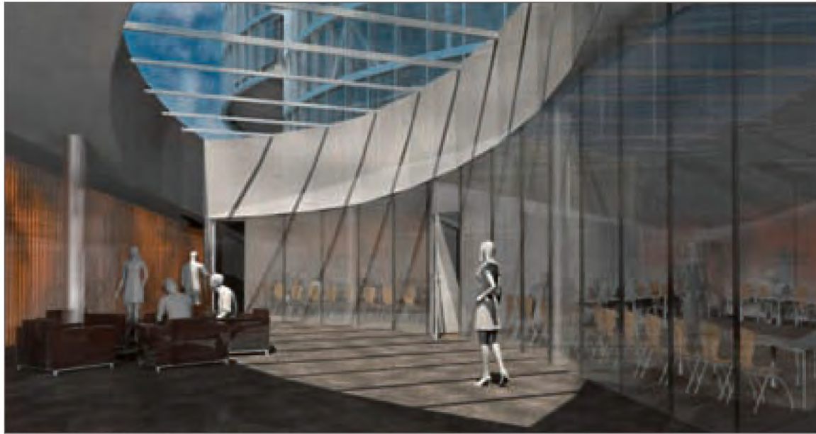
► Le projet a séduit le maître d'ouvrage.

nous avons retenu l'idée des pétales, qui s'adaptent au site. Il n'y a pas un seul pan de façade droite! Ces lignes fluides reflètent également la fragilité, la beauté de la paix».