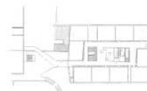
plan niv. +1